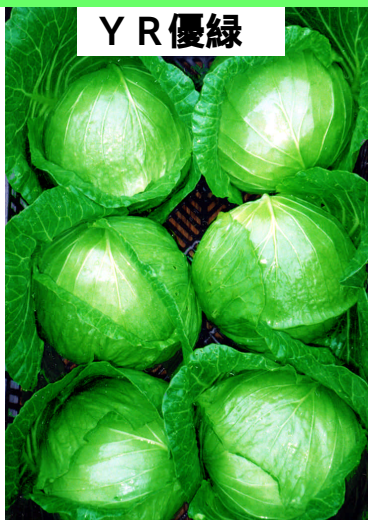
Y R 優緑