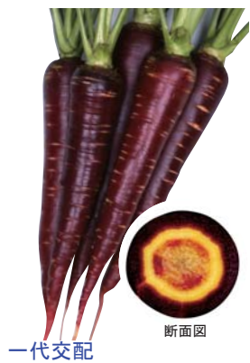
一代交配 バイオレットハーモニー