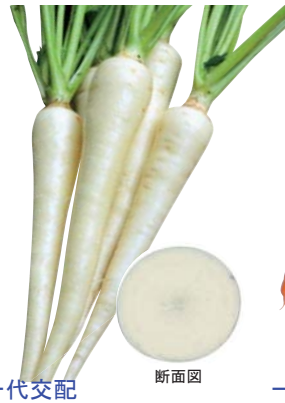
一代交配 ホワイトハーモニー