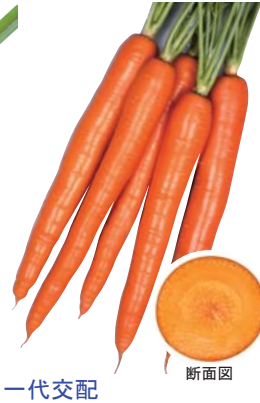
一代交配 オレンジハーモニー