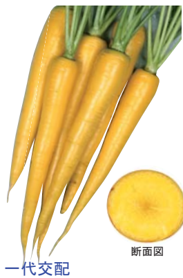
一代交配 イエローハーモニー