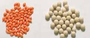
↑ ネオコート種子 従来コート種子

ハーモニーシリーズの販売は全てネオコート種子になります。薄くコーティングされており播種しやすい形状で、土との識別がしやすいように着色されています。大きさは左図のように、一般的なコート種子より小さいタイプです。お持ちの播種機に対応できない可能性がありますので、ご購入の前に確認をお願い致します。