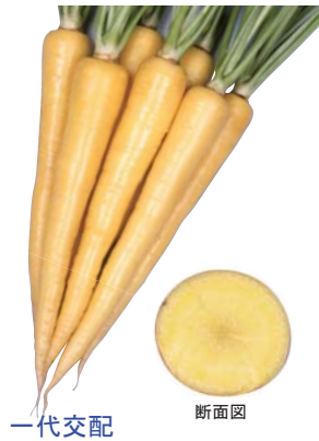
一代交配 クリームハーモニー