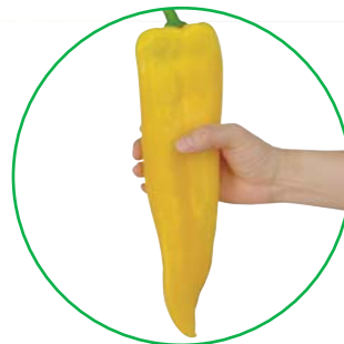
パプロングゴールド