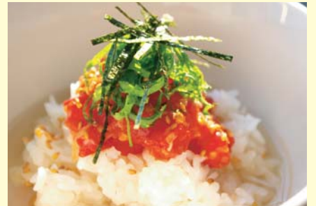
●トマトのお茶漬け