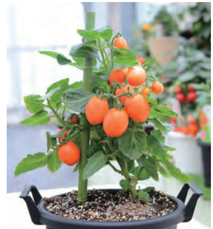
宇治交配 こ (MTX-072) ぷちっ娘オレンジ