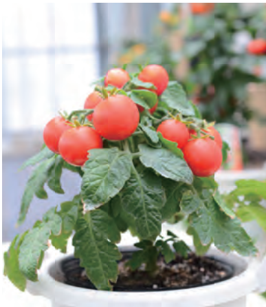
宇治交配 こ (MTX-070) ぷちっ娘レッド

放任栽培でミニトマトができる芯止まり型の矮性ミニトマト。 美味しく3色揃って、ベランダ菜園などに最適！