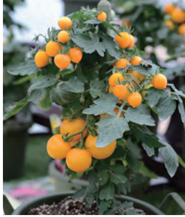
宇治交配 こ (MTX-071) ぷちっ娘イエロー