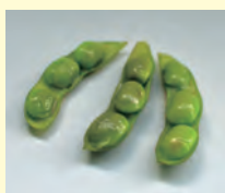
↑子実が黒味を帯びてきた頃が食べごろ ←収穫適期の株